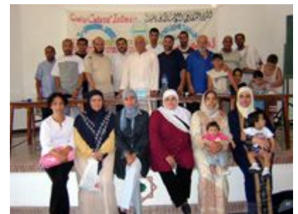
Campamento y curso de verano en Azzagra