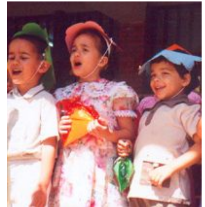
Fiesta fin de curso de la escuela del CCIV

Campamento y curso de verano "El Islam es convivencia, conocimiento mutuo, diálogo". Con la Colaboración de la Liga Islámica para el diálogo y la Convivencia y de la Fundación Azzagra. Celebrado en la Facultad de Estudios Andalusíes. La Puebla de Don Fadrique, del 9 al 14 de julio de 2004.