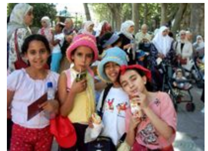
Excursión a Xàtiva