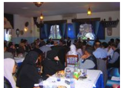
Comida de Convivencia Pacífica y Mutuo Conocimiento. 'Id-al fitr 2004.