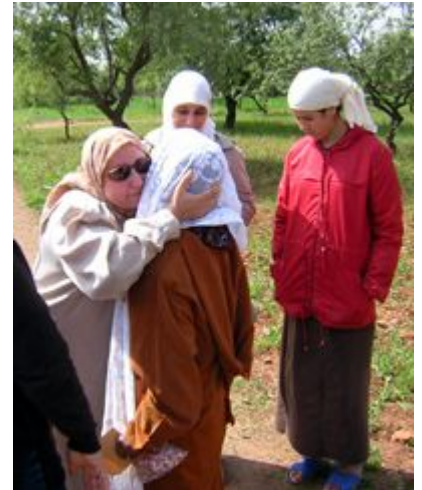
Caravana solidaria a Marruecos. Miembros del CCIV solidarizándose y ayudando a las damnificadas del terremoto.