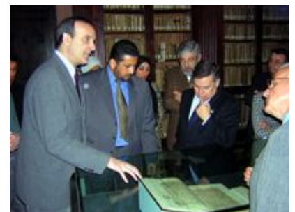
Exposición de manuscritos andalusíes "ISLAM CIVILIZACIÓN DEL LIBRO"