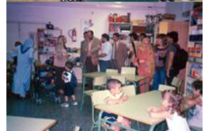
madrasa (escuela) del CCIV