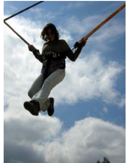
Campamento de primavera en Benageber