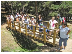
Turismo propone dos rutas en la naturaleza para el fin de semana