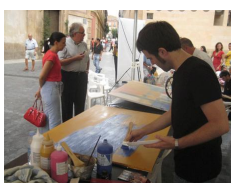
XI Premio Cámara de Murcia para jóvenes pintores