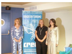
Turismo presenta su oferta de festivales en la Feria de Interior de Valladolid

A este respecto, el documento destaca "la virulencia de este tipo de problemas en Murcia en espacios enterrados, de lo que tenemos una larga experiencia. Si el fenómeno es difícil de controlar en pequeños espacios o sobre estructuras de gran porte, como la propia muralla islámica, se acentúa gravemente en una superficie a conservar amplia y de estructuras de muros de elevada delgadez".