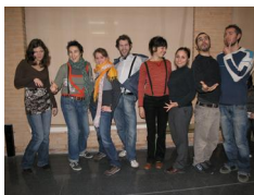
Más de 250 jóvenes han participado en proyectos de voluntariado europeo