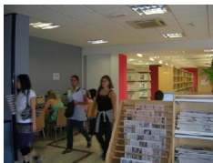
Cámara contribuye a la ampliación de la biblioteca de Jesús Abandona