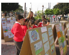
Dibujos para luchar contra el cambio climático