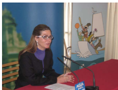
El Centro Fuente Columbares presenta nuevas temáticas en actividades para 2010