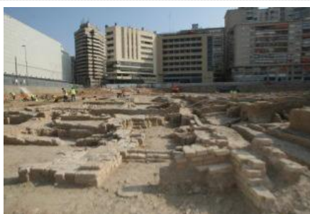
Panorámica del yacimiento islámico que la consejería de Cultura ha decidido conservar en pleno centro de la ciudad en la plaza que cubrirá el aparcamiento MARCIAL GUILLEN

MANUEL MADRID La decisión de la dirección general de Bellas Artes y Bienes Culturales de conservar parte del barrio islámico de San Esteban como un espacio urbano único en España y su compatibilidad con la construcción de un aparcamiento subterráneo fue interpretado ayer como una solución salomónica para satisfacer los intereses tanto del Ayuntamiento, que podrá seguir adelante con el parking aunque tendrá que modificar el proyecto, como de los colectivos sociales, que reclamaban la salvación de estos restos y su puesta en valor "como un atractivo cultural".