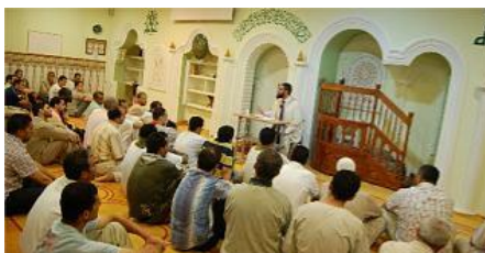
El imam se dirige a los fieles en el centro de oración del Centro Cultural Islámico de Valencia.

La primavera de los musulmanes quedó inaugurada con la puesta de sol del pasado viernes. La fiesta más esperada del calendario islámico llegó tras doce lunas. Rezos, ayunos y buenas acciones purgarán el espíritu de los fieles que durante estas treinta jornadas se abstendrán de comer, beber, fumar o tener actuaciones "inmorales" desde el amanecer hasta el ocaso.